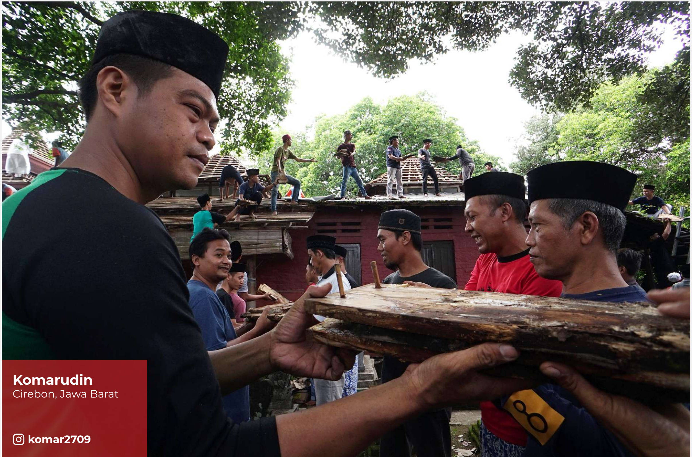
Komarudin Cirebon, Jawa Barat