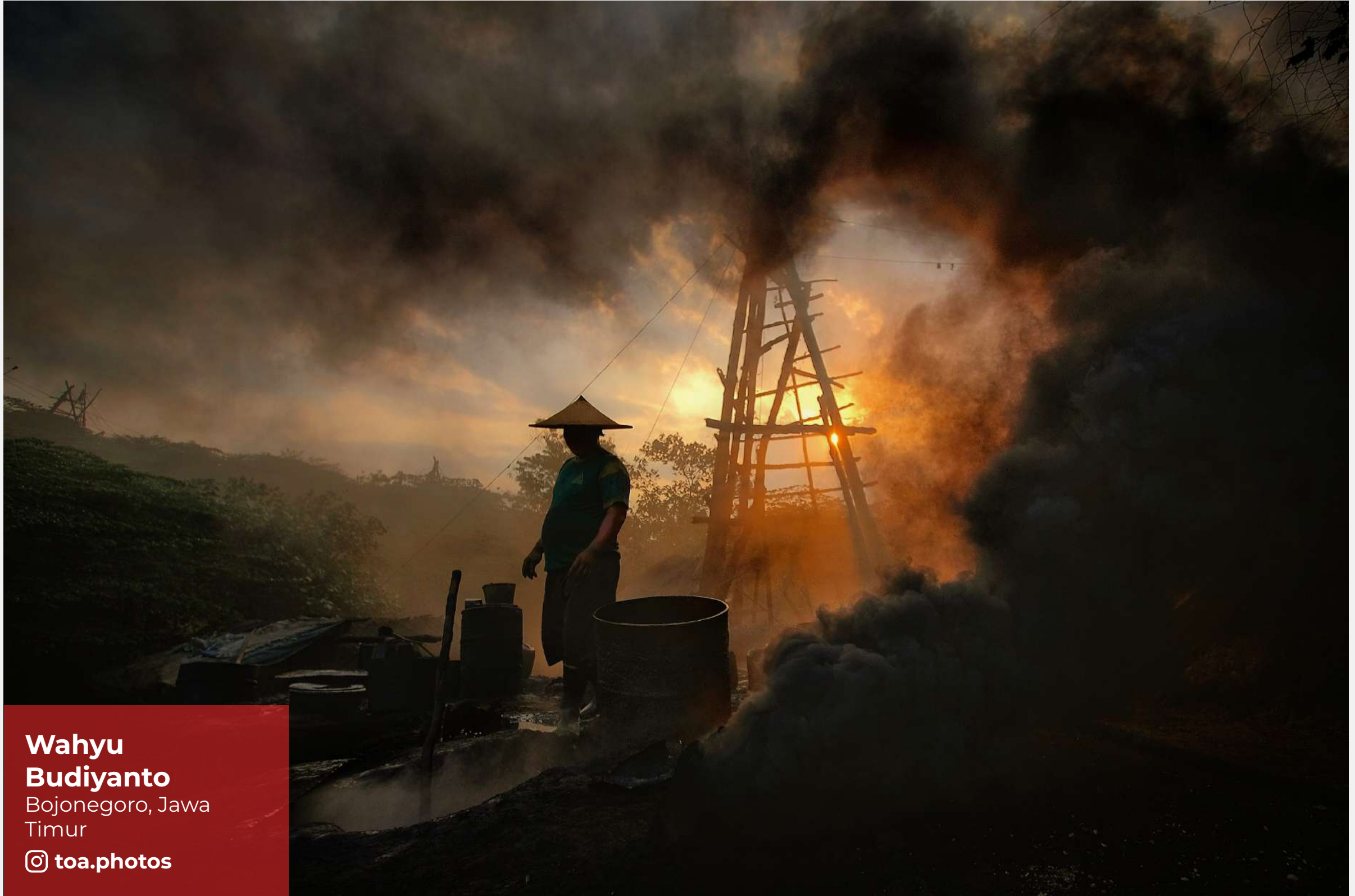
Wahyu Budyanto Bojonegoro, Jawa Timur

Tambang Minyak Tradisional Wonocolo terletak di Kabupaten Bojonegoro, Jawa Timur. Wonocolo memiliki potensi yang unik dan berbeda dari wisata lainnya. Tak seperti kebanyakan tambang minyak pada umumnya, proses penambangan di lokasi ini masih dilakukan secara tradisional. Memiliki nama lain Petroleum Geopark Wonocolo, tempat tersebut disebut-sebut sebagai wisata migas pertama di Indonesia.