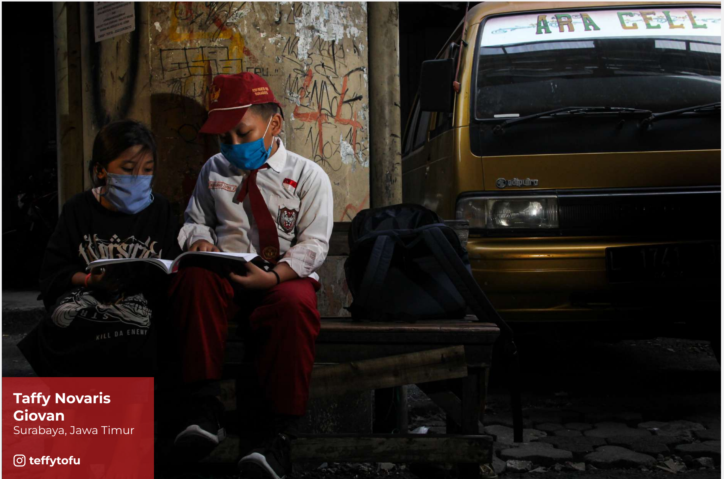
Taffy Novaris Giovan Surabaya, Jawa Timur