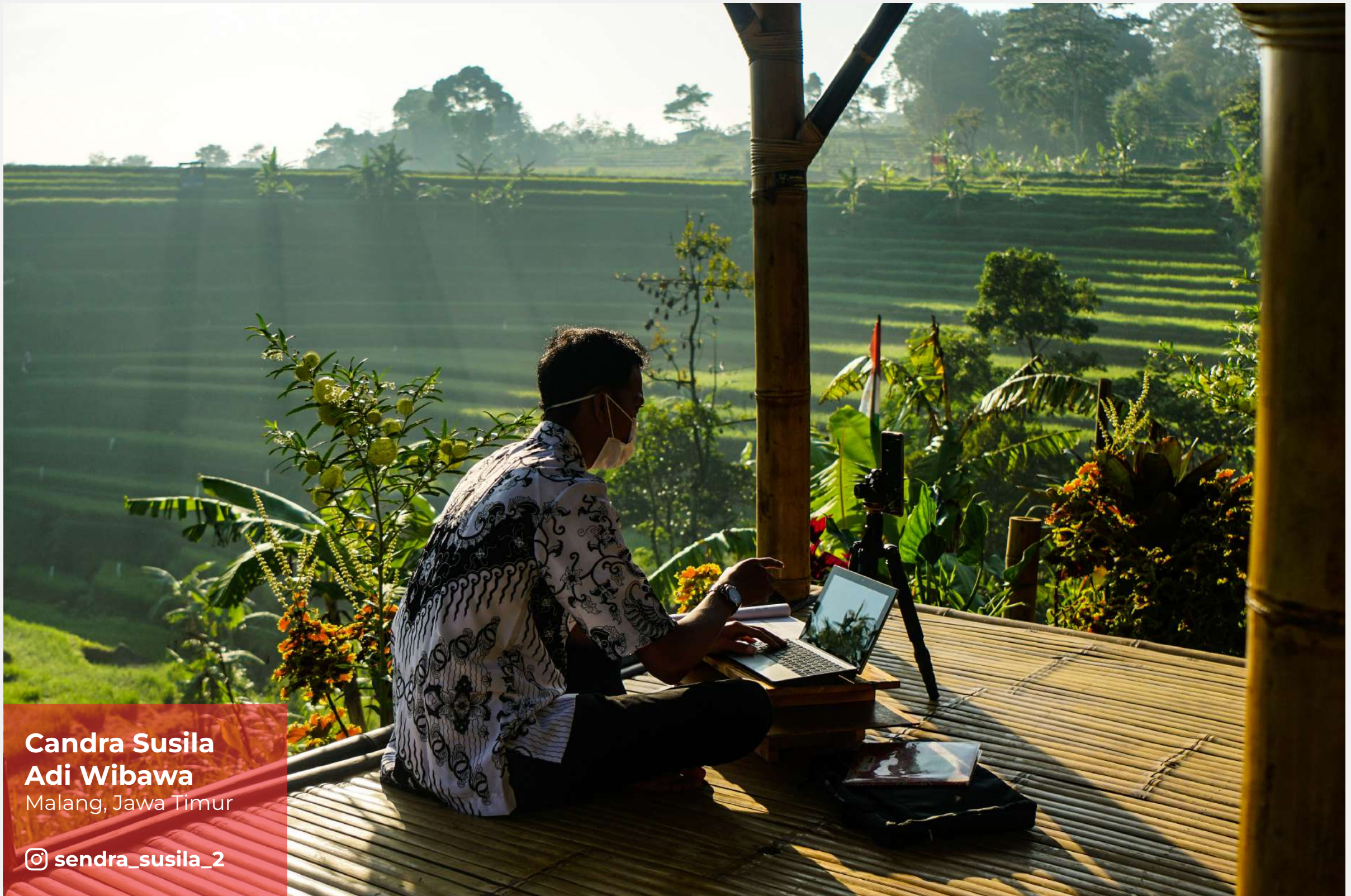
Seorang guru memanfaatkan digital di daerah pelosok untuk para siswa.